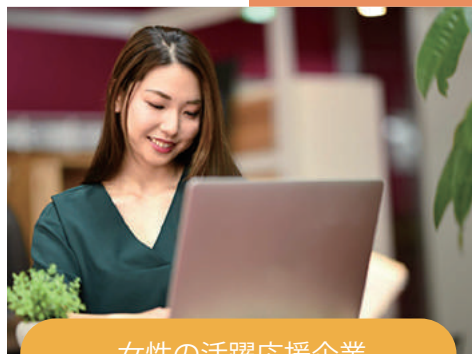
女性の活躍応援企業