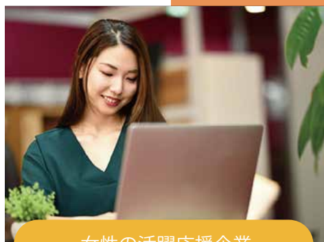
女性の活躍応援企業